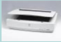
図11 ES-8000 (セイコーエプソン)