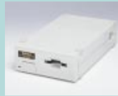
図19 LS-1000 (ニコン)