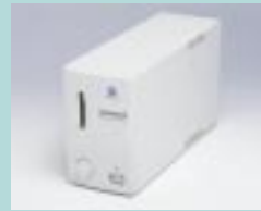
図20 QuickScan 35 (ミノルタ)