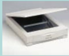
図9 CanoScan 600DX (キヤノン)