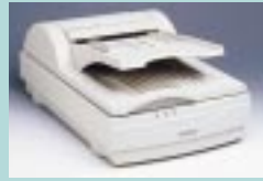
図12 ScanTouch 110 (ニコン)