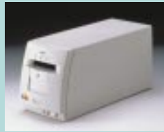
図17 Qscan (コニカ)