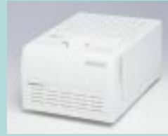
図13 ScanMaker 35t plus (台湾Microtek社)