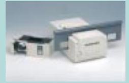
図15 ES-10S MAC (オリンパス光学工業)