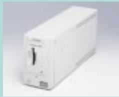
図16 CanoScan 2700F (キヤノン)