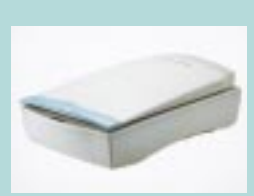
図5 JADE 2 (独 Linotype CPS 社)