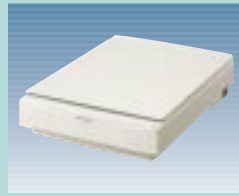
図10 JX-250M3 (シャープ)