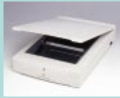
図2 Apple Color OneScanner 1200/30 (米 Apple Computer 社)