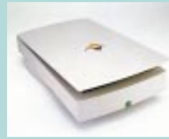
図4 HP ScanJet 5p (米 Hewlett-Packard 社)