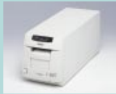
図18 FS-1300ART (セイコーエプソン)