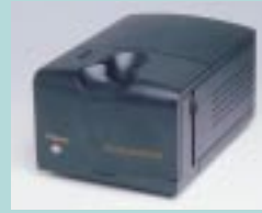
図14 POLASCAN 35 Ultra (米Polaroid社)