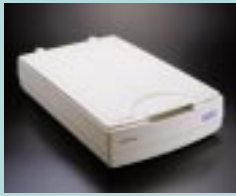
図6 ScanMaker 9600XL (台湾MICROTEK社)