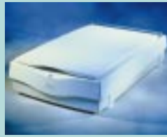
図8 Astra 1200S (台湾UMAX社)