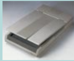
図3 AVA3 (台湾 Avisision 社)