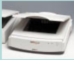
図1 SnapScan 600 (ベルギー Agfa-Gevaert 社)