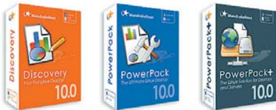
▲ Три варианта: для начинающих, опытных и профессиональных пользователей

Кроме того, в данном релизе подверглась значительной модификации подсистема автоматической настройки имеющегося у пользователя аппаратного обеспечения. Например, была включена