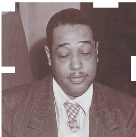
▲ Дюк Эллингтон не знал, что пишет музыку для мобильных телефонов

Развитие мобильной связи, в ходе которого были решены сложнейшие технические проблемы, совершенно неожиданно привело к возникновению юридических проблем. Например, мелодии для мобильных телефонов, или рингтоны (ringtones), поначалу были придуманы по принципу: «а нельзя ли сделать так?»