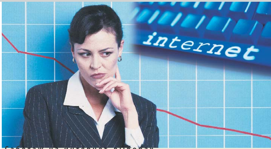
Саботаж на интернет-выборах