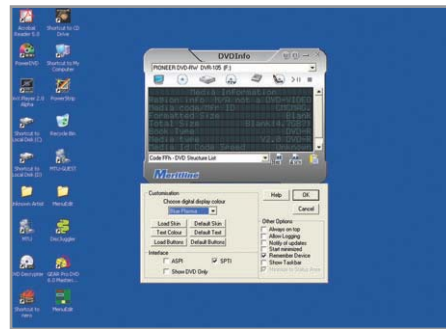
▲ Внешний вид удобной и функциональной утилиты DVDInfo