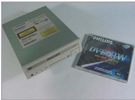
▲ Philips стала первой компанией, высказавшейся за стандарт «плюс»