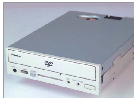
▲ Первый привод из линейки Pioneer, научившийся записывать на 2x

Владельцам рекордеров типа +R/+RW, по-видимому, никогда не узнать, что же порой испытывают хозяева «минусовых» приводов, ведь для них запись на 1x является скорее опцией, которую поддер-