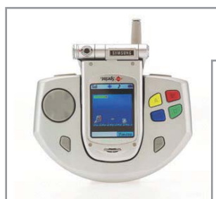
Chameleon. ► Красивая идея