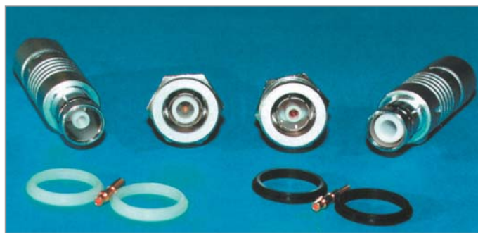
Разъемы для соединения устройств коаксиальным кабелем

сочетание между пропускной способностью и длиной. Их соотношение является одним из ключевых элементов спецификаций физического уровня, в которых хотя и не описывается траектория прокладки кабеля, но регламентируются его толщина, типы нагрузки на концах, максимальные расстояния и пропускная способность.